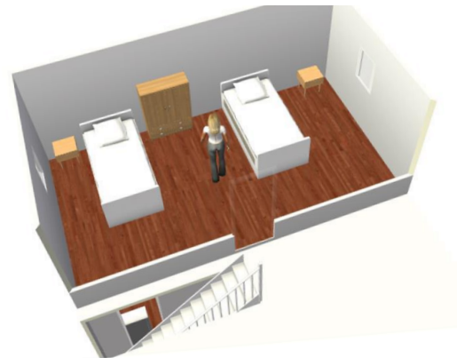
Étage gîte Bel Orient