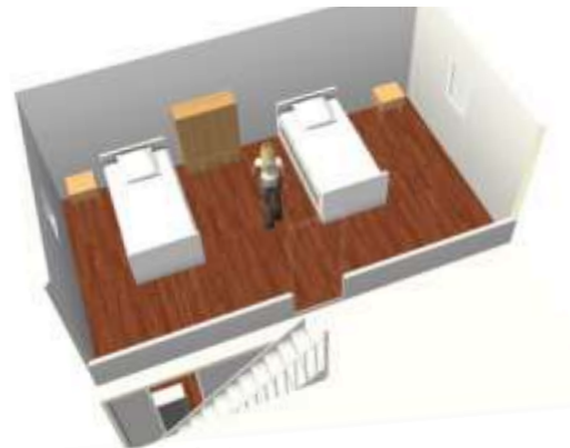
Étage gîte Bel Orient